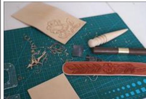
Мастерская по художественной обработке кожи. В мастерской по художественной обработке кожи.