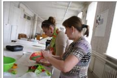
Мастерская по художественному валянию войлока. Члены многодетных семей обучаются художественному валянию войлока. Тепло в руках - тепло в семье.