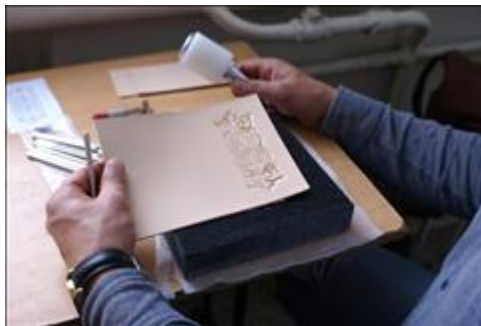
Мастерская по художественной обработке кожи. В мастерской по художественной обработке кожи.