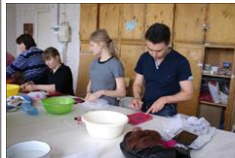
Мастерская по художественному валянию войлока. Члены многодетных семей обучаются художественному валянию войлока. Тепло в руках - тепло в семье.