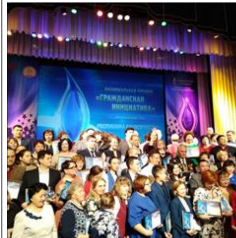
Церемония награждения победителей регионального этапа Национальной премии «Гражданская инициатива». Фото участников на память.