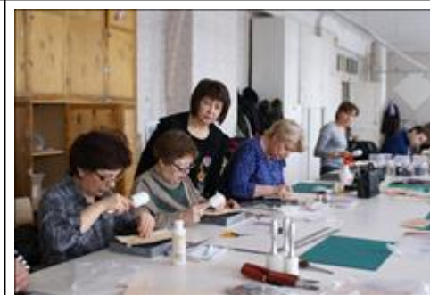
Мастерская по художественной обработке кожи. В мастерской по художественной обработке кожи.