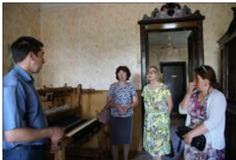
Предполагаемое место организации Дома ремесел. г. Бирск Осмотр старинной усадьбы дома купца Горохова, г. Бирск. Объект культурного наследия требует капитального ремонта.