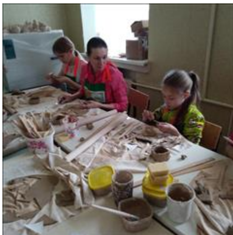
Занятия в гончарной мастерской, г. Уфа. Мама с дочкой обсуждают будущее изделие.

Электронные версии материалов (бюллетеней, брошюр, буклетов, газет, докладов, журналов, книг, презентаций, сборников и иных), созданных с использованием гранта в отчетном периоде (при условии, что такие материалы не содержатся в материалах, указанных в подпункте 5 настоящего пункта)