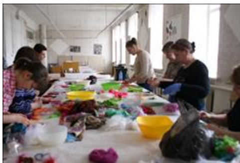
Мастерская по художественному валянию войлока. Члены многодетных семей обучаются художественному валянию войлока. Тепло в руках - тепло в семье.