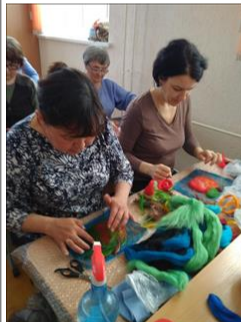
Проведение занятий по художественному валянию войлока, г. Бирск. Первые навыки по работе с шерстью.