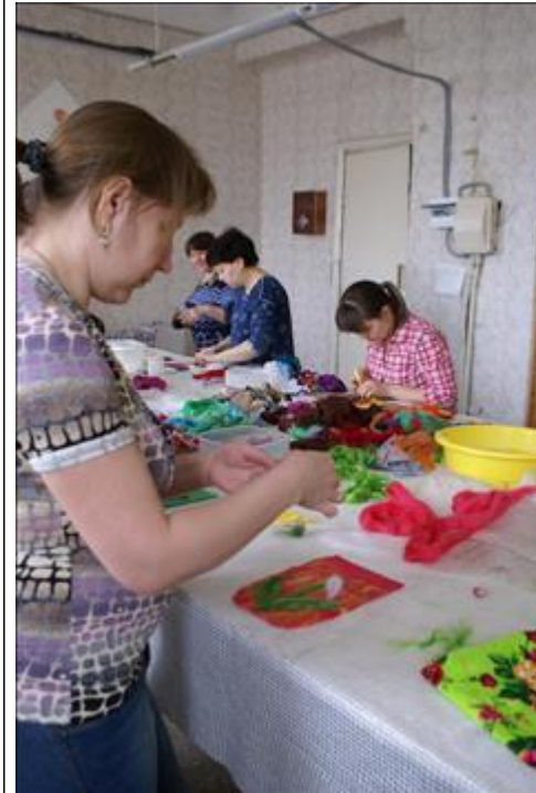
Мастерская по художественному валянию войлока. Члены многодетных семей обучаются художественному валянию войлока. Тепло в руках - тепло в семье.