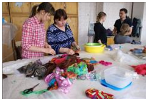
Мастерская по художественному валянию войлока. Члены многодетных семей обучаются художественному валянию войлока. Тепло в руках - тепло в семье.