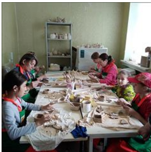
Занятия в гончарной мастерской, г. Уфа. Мамы с детьми обучаются ручной лепке из глины.