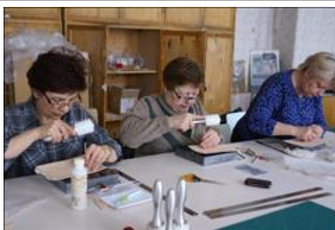
мастерская по художественной обработке кожи. В мастерской по художественной обработке кожи.

Информация, указанная Вами в данном поле отчета, будет доступна для посетителей сайта Фонда президентских грантов (в том числе представителей СМИ)