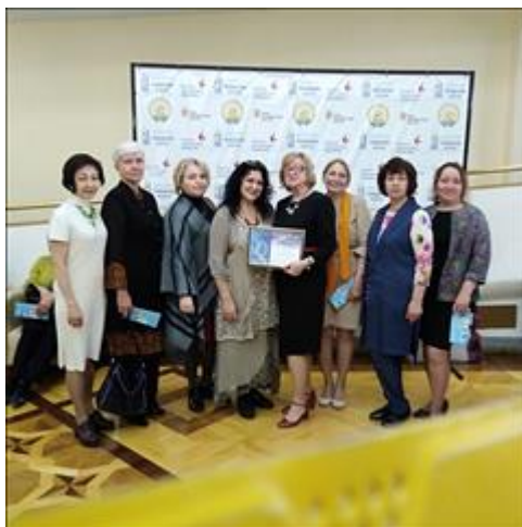
Церемония награждения победителей регионального этапа Национальной премии «Гражданская инициатива» Организаторы и преподаватели Школы ремесел на Церемонии награждения победителей регионального этапа Национальной премии «Гражданская инициатива». Наш проект участвовал в номинации «Духовное наследие».