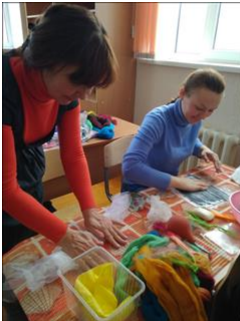
Проведение занятий по художественному валянию войлока, г. Бирск. Интерес к ремеслу от "мала до велика".