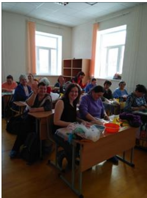
Проведение занятий по художественному валянию войлока, г. Бирск. Группа жителей г. Бирск и Бирского района на занятиях.